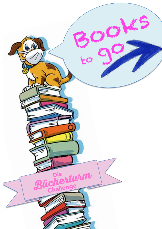
Foto: Teresa Wörther, Grafiken vom Projekt Büchertürme, www.buechertuerme.de

Teresa Wörther, Studienrätin und Bibliotheksbeauftragte am Kurt-Körper-Gymnasium (KKG) zum geförderten Projekt Büchertürme